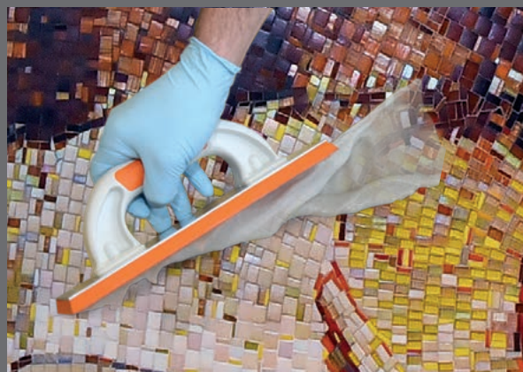
Meget smidige fugeegenskaber – som cementbaseret fugemørtel. Med kun én hånd, uden specialværktøj.