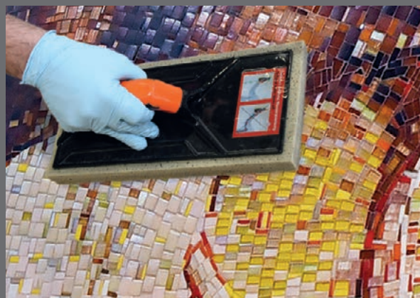
Meget let afvaskning uden restslør – med rensedmidlet PCI Durapox® Finish.